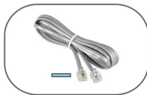
B) RJ11 Kabel