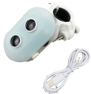
Hindernismelder Cane Sonic